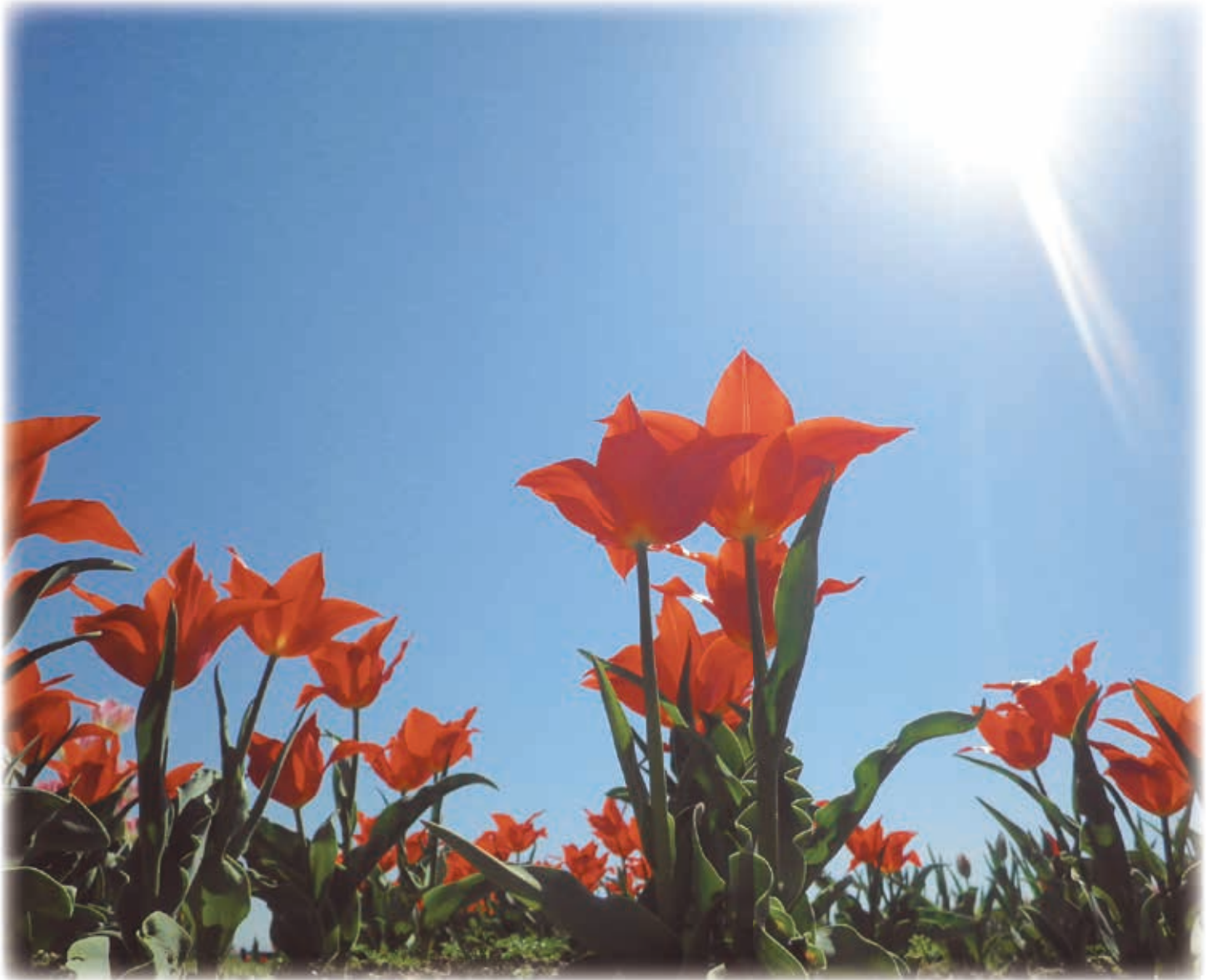
香焼地区に咲くチューリップを撮影

杠葉病院は、大正13年に創設された精神科の医療機関です。 長崎市南部の緑豊かな環境の中、地域に根差した医療を心がけています。 職員一同、「患者様本位の医療と看護」の理念に基づいた人間的温かみのある 医療サービスの提供に努めます。