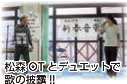
松森 OT とデュエットで歌の披露!!